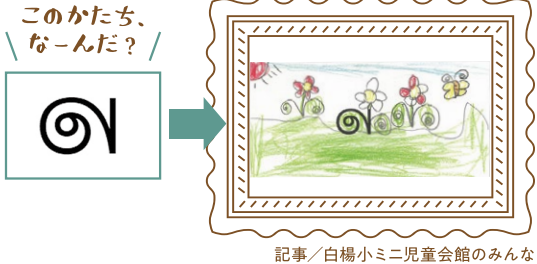
記事/白楊小ミニ児童会館のみんな