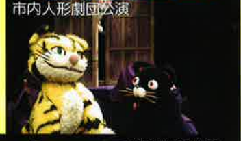
市内人形劇団公演