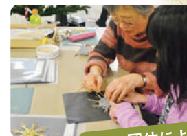
団体による 体験プログラムの出展