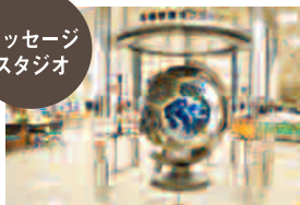
メッセージ スタジオ

地球儀の周りには、さまざまな環境問題が模型で表現されています。また、私たちの暮らしとどのように関係しているのかを考えることができます。