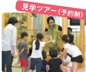
見学ツアー(予約制)