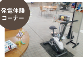
発電体験 コーナー

実際に体を動かして発電し、そのエネルギーでライトを点けたり音楽を鳴らすことで、エネルギーの大切さを体感することができます。