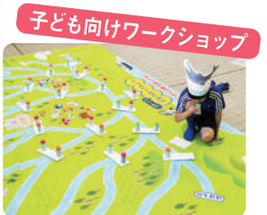
子ども向けワークショップ

情報と人、人と人、環境と人をつなぎます。 人材育成や環境学習の機会や場を増やすことを目指しています。