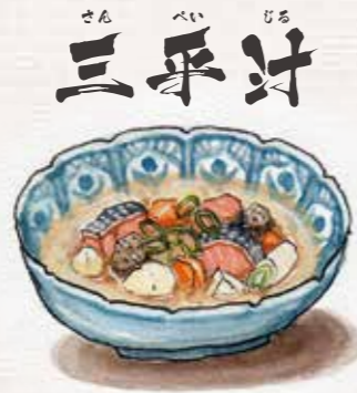
三平汁 塩漬けや糠漬けにしたニシンと季節の野菜を汁ものにしたもの。魚は鮭やタラもある