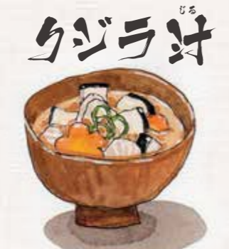
クジラ汁 クジラの脂身にフキやワラビなどの山菜、大根、ごぼう、里芋。豆腐を加えたしょうゆ味の汁もの