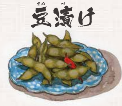
豆漬け 枝豆をさやごとゆでて塩漬けたもの

“郷土料理”とは 地域の歴史と風土の中で、その時季に採れた作物を使って、祭りや行事に作られてきた料理がその地域ごとに伝わってきました。これが“郷土料理”です。一方、道外からの移住者が多く暮らす北海道では、生まれ育ったふるさとの味が家ごとに伝えられ、それが“おふくろの味”“わが家の味”となっている料理もあります。