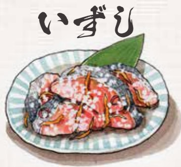
いずし 魚と大根、キャベツなどの野菜を麩やご飯と合わせてつけ込んだもの