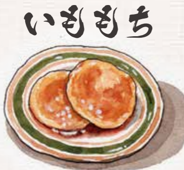
いももち ゆでたじゃがいもをつぶしてデンプンをまぜて丸めて焼いたもの