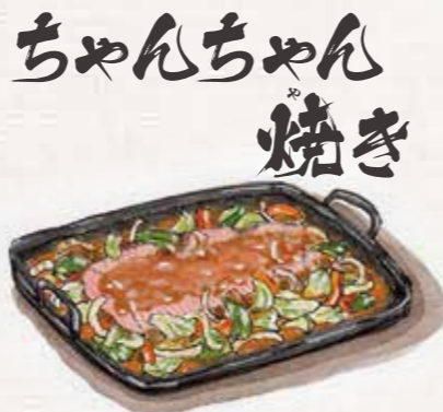
ちゃんちゃん焼き 鮭をキャベツなどの野菜と鉄板で焼いたもの