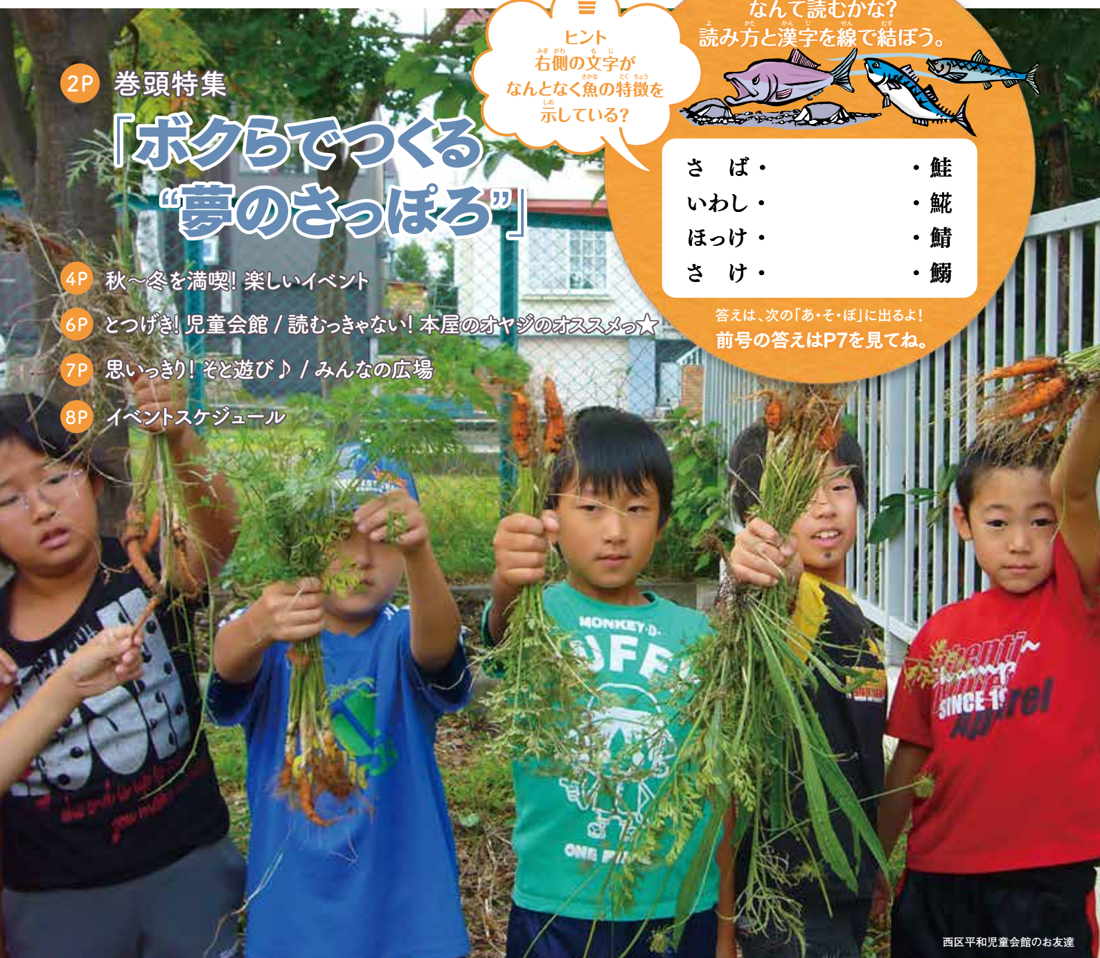
西区平和児童会館のお友達