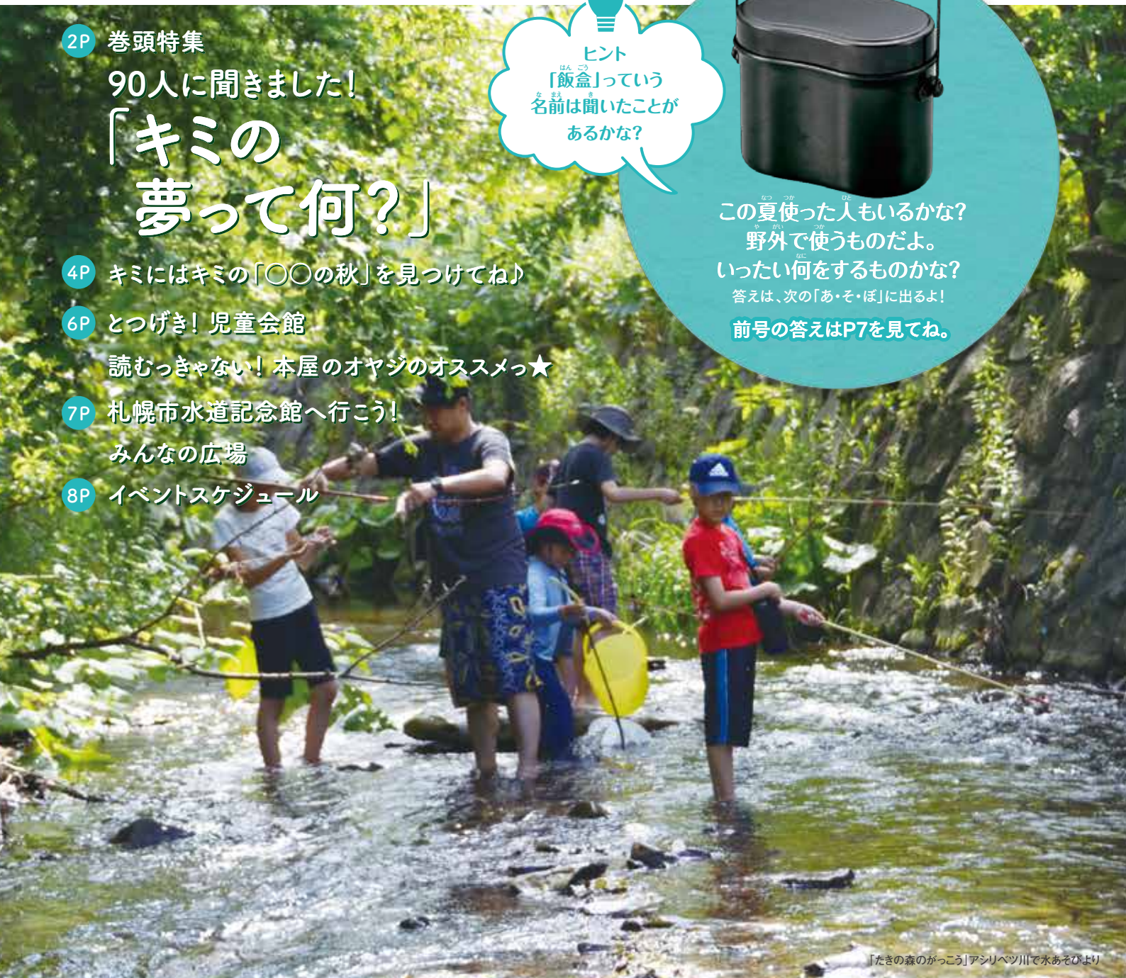
「たきの森のがっこう」アシリベツ川で水あそびより