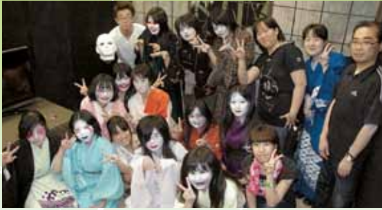
昨年のおばけ屋敷スタッフのみなさん

東区北27東15 ☎723-5911 http://www.syaa.jp/sisetu/gekijou/index.htm