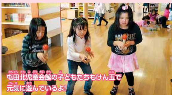
屯田北児童会館の子どもたちもけん玉で元気に遊んでいるよ!

大皿に玉をのせ、真上に玉を上げます。玉が空中にある間にけん玉の回りを1回転回して落ちてきた玉を大皿で受けます