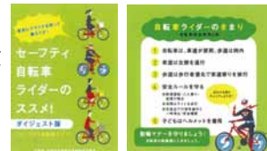
配布中のパンフレット。自転車安全五則を知っていますか?

北海道警察のホームページで自転車安全クイズにチャレンジするこ とができますよ。 http://www.police.pref.hokkaido.lg.jp/kids/quiz_top.html