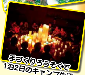
手づくりろうそくで1泊2日のキャンプ生活