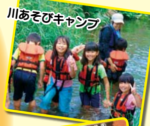
川あそびキャンプ