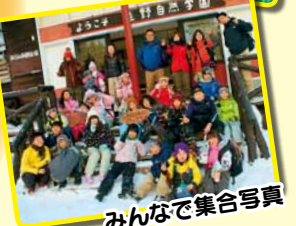
みんなで集合写真