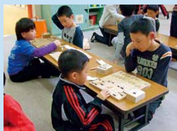
プレイルームで将棋。次はどの手にしようかな?