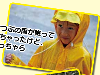
大つぶの雨が降ってきちゃったけど、へっちゃら