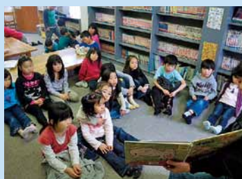
図書室で絵本の読み語り。みんな真剣