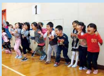
体育室でクイズ大会。みんな正解「わあ、やったー!」