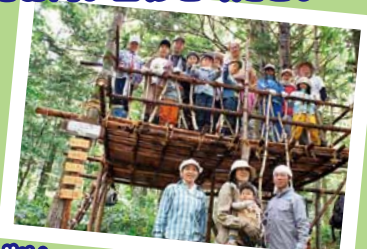
ツリーハウスをみんなで作りしました