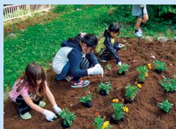
みんなで花だん作り。キレイな花が咲きますように!