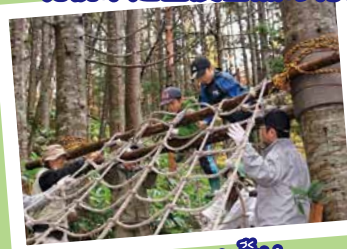
アスレチック作り