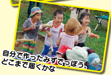
自分で作ったみずでわぼう。どこまで届くかな