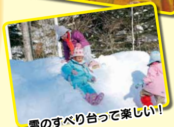
雪のすべり台って楽しい!