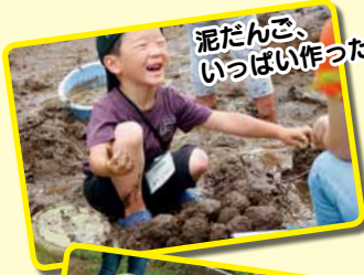
泥だんご、いっぱい作ったよ

風の音、太陽の光、木のおい、カラダいっぱいわくわく体験。森のようちえんはすべての感覚をオープンにして親子で“あそびこむ”ことができる場所です。