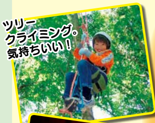
ツリークライミング。気持ちいい!

子どもたちにとって自然が学校であり、先生。森にしか子どもたちに教えることができないこと、森でしか教えてもらうことができないこと。森での自然体験活動を通して、環境や自然への気づきを育みます。