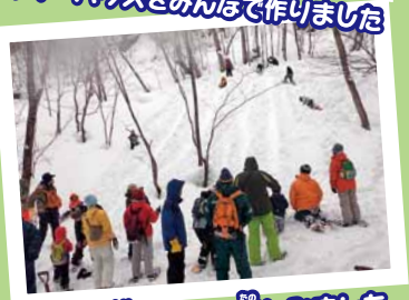
リング戻すべりを楽しみました