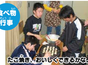
たこ焼き、おいしくできるかな。