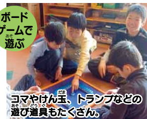
コマやけん玉、トランプなどの遊び道具もたくさん。