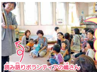
読み語りボランティアの編さん

市内の児童会館で毎週1回行っています。西宮の沢児童会館では地域ボランティア「はじめの歩」の皆さんが絵本の読み語りをしています。