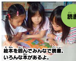
絵本を囲んでみんなで読書。いろんな本があるよ。