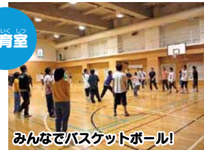
みんなでバスケットボール!