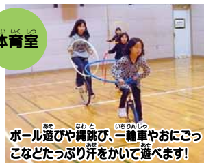
ボール遊びや縄跳び、一輪車やおにごっこなどたっぷり汗をかいて遊べます!