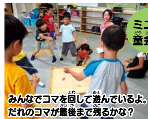
みんなでコマを回して遊んでいるよ。だれのコマが最後まで残るかな?