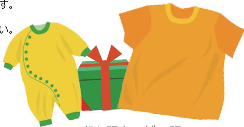
こども服とベビー服