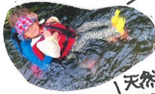
天然ウォーター スライダー

「木のようちえん」では幼児期の子ともたちが保護者と 一緒に自然豊かな森の中でのびのびと遊ぶことが できる場所を提供しています。 また季節に応じて様々な体験プログラムもご用意しています。